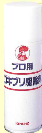
プロ用ゴキブリ駆除剤