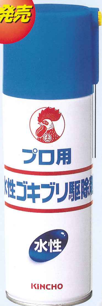
水性プロ用ゴキブリ駆除剤