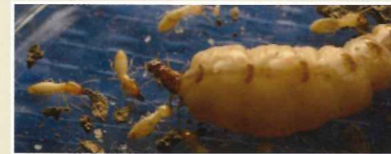
イエシロアリ(女王、働きアリ、兵隊アリ)

日本で建造物に大きな被害を与えるのはイエシロアリとヤマトシロアリの2種類です。これらのシロアリは湿気を好むため、浴室、台所、洗面所の土台、敷居、床組などあるいは雨漏りのある所が被害を良く受けます。さらにイエシロアリは巨大なコロニーを造ることが出来るので屋根裏まで被害が広がることがあります。