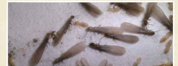
ヤマトシロアリ(羽アリ、働きアリ、兵隊アリ)