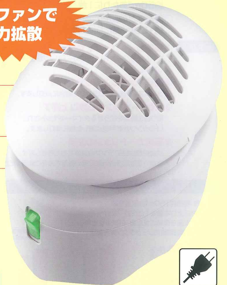
ハニカム防虫ファンAC器具

食品・薬品工場、ホテルや飲食店などの害虫侵入防止、衛生対策としてご使用ください。