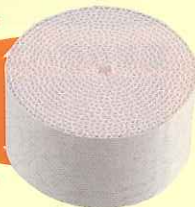
専用薬剤カートリッジ

食品・薬品工場、ホテルや飲食店などの害虫侵入防止、衛生対策としてご使用ください。